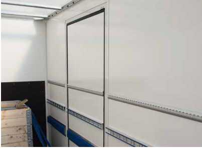
Innenbündige Seitentür* vermeidet Ladungsschäden beim Durchschieben.