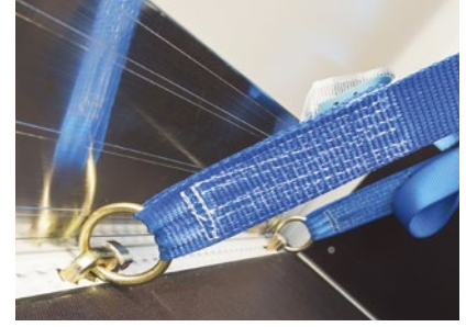
Seitliche Airline-Schienen im Boden.