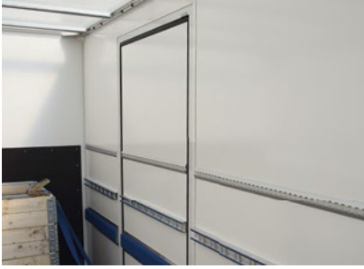
Innenbüdige Seitentür* vermeidet Ladungsschäden beim Durchschieben.